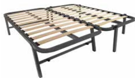
DETALLE 2 CAMAS